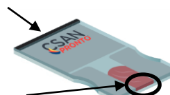
le triangle soit positionné vers le haut